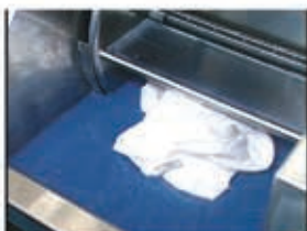
1. Aquatitan: In der Maschine wird dem Wasser gelöstes Titan hinzugefügt

Der Japaner Yoshihiro Hirata entdeckte bei seiner behandelnden Tätigkeit als Chiropraktiker eine Energie, die sogenannte PHILD ENERGIE. Seiner Entdeckung, Idee und Motivation etwas Gutes für die Menschen zu tun, entsprang PHITEN. In diesem Unternehmen entstand ein Verfahren, die PHILD ENERGIE an einen Träger zu binden. Das Titan zeigt hierbei die besten Eigenschaften und ermöglicht durch Verarbeitung die Erzeugung von verschiedensten Produkten. Phiten Titanprodukte werden von verschiedenen Sport- und Physio-Therapeuten und auch von vielen Profisportlern bis hin zum Freizeitsportler verwendet.