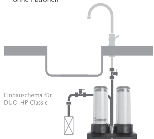
Einbauschema für DUO-HP Classic