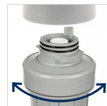
QuickConnect Verbindung zwischen Filtergehäuse und Kopf