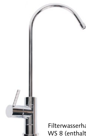
Filterwasserhahn WS 8 (enthalten)